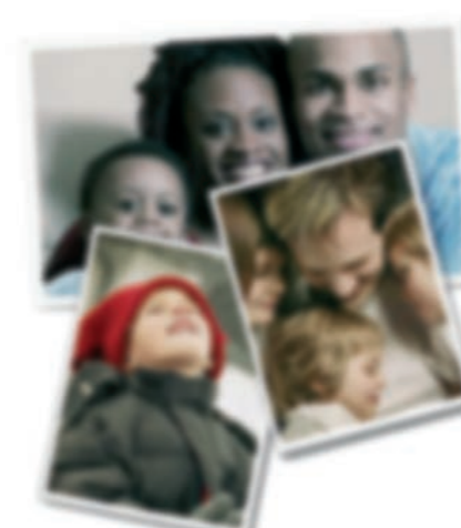
Photos, dessins d'enfants