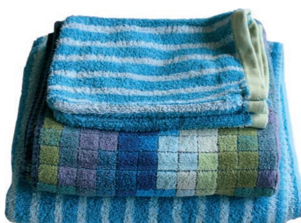
Linge de toilette