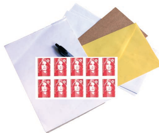
Nécessaire de courrier

Emballer les aliments dans des boîtes en plastique transparent ou des sachets plastiques (type sachets de congélation) fermés avec des élastiques ou des liens sans métal